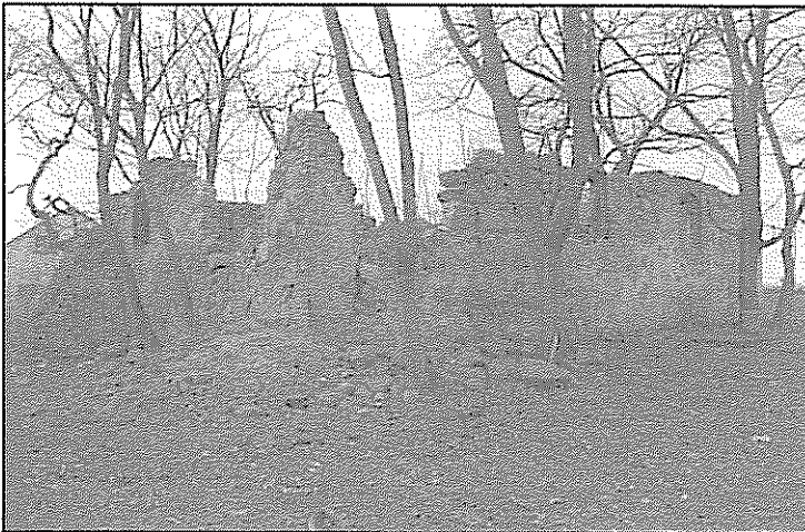
II. 2. Pomietów, pow. stargardzki. Ruina kościoła wiejskiego z ok. 1600 r., od strony północno - wschodniej. Stan z marca 2000 r.