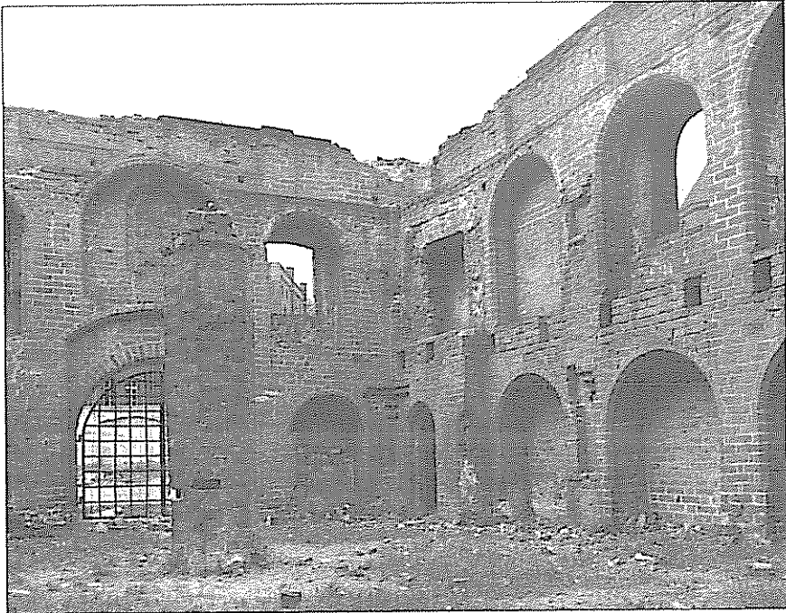
Ilustr. 1. Wnętrze Arsenalu przed odbudową, fot. K. R. Janowski. Ze zbiorów Archiwum Państwowego w Szczecinie. Oddział w Stargardzie