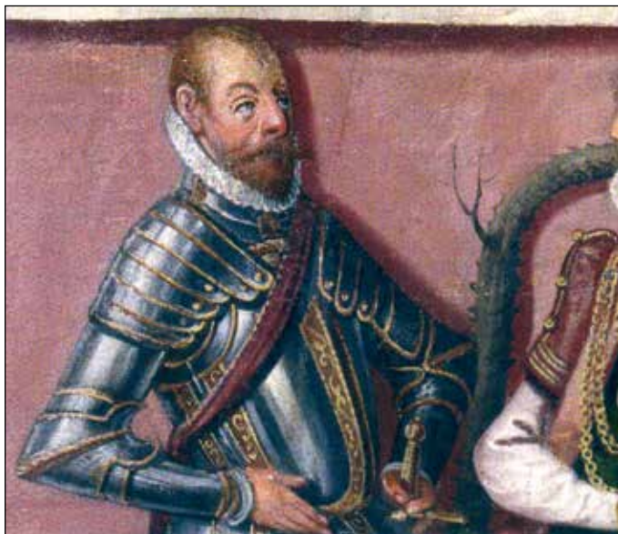
Ryc. 8. Bogusław XIII na drzewie genealogicznym książąt pomorskich z 1598 r. autorstwa Corneliusa Krommeny, wg Makala 2013b, ryc. 115