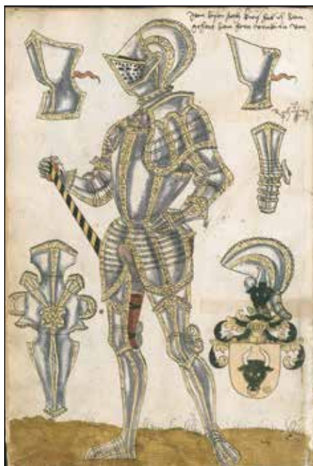
Ryc. 1. Küriss według Jörgo Sorga, wg http://www.wlb-stuttgart.de/