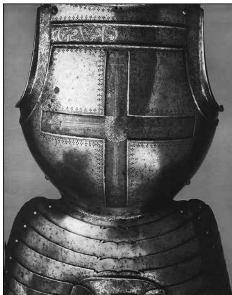
Ryc. 4. Napierśnik kostiumowy przynależny do zbroi Albrechta Hohenzollerna (ryc. 3). Ze zbiorów Staatliche Kunstsammlungen Dresden, wg Schöbel 1973, ryc. 1