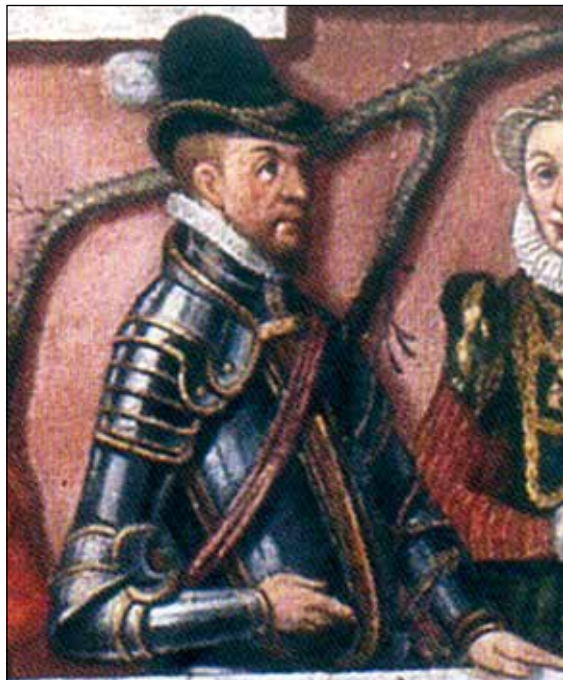
Ryc. 7. Barnim XII (X) na drzewie genealogicznym książąt pomorskich z 1598 r. autorstwa Corneliusa Krommeny, wg Makala 2013b, ryc. 115