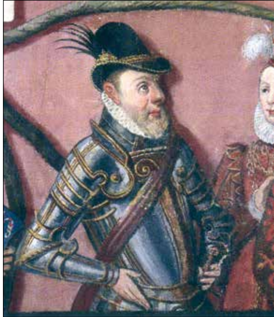
Ryc. 6. Jan Fryderyk na drzewie genealogicznym książąt pomorskich z 1598 r. autorstwa Corneliusa Krommeny, wg Makala 2013b, ryc. 115