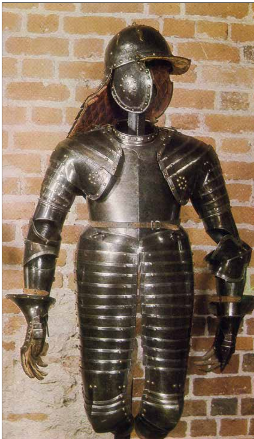
Ryc. 11. Zbroja kiraserska wykonana w 1 poł. XVII w. najprawdopodobniej w Niemczech. Państwowe Zbiory Sztuki na Wawelu, wg Żygulski jun. 1984, ryc. 142