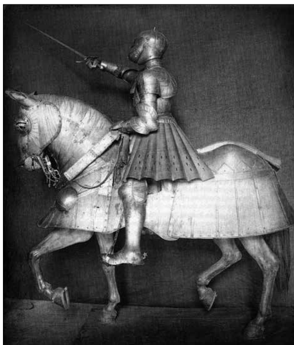
Ryc. 2. „Zbroja legnicka”, wg Cieśla 2015, ryc. 1