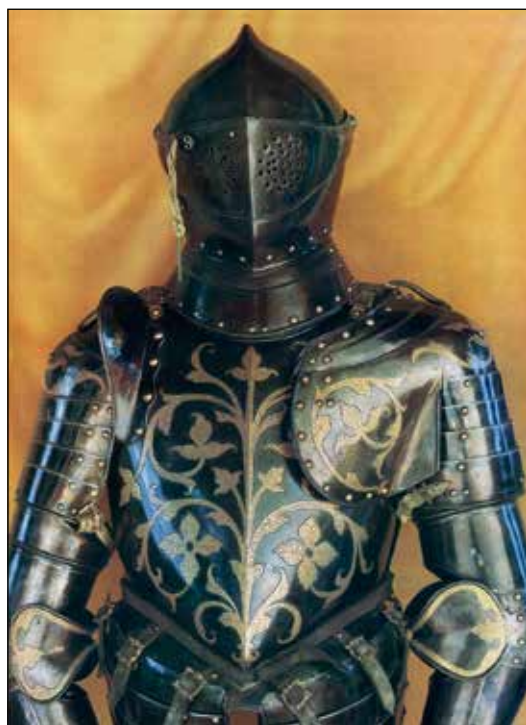
Ryc. 9. Zbroja płytowa z napiersnikiem z gęsim brzuchem wykonana przez Antona Peffenhausera w 1591 r. Ze zbiorów Staatliche Kunstsammlungen Dresden, wg Schöbel 1973, ryc. 10