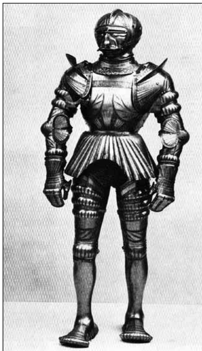
Ryc. 3. Zbroja kostiumowa Albrechta Hohenzollerna wykonana przez Kolmana Helmschmida w 1510 r. Ze zbiorów Metropolitan Museum of Art w Nowym Jorku, wg Cieśla 2015, ryc. 14