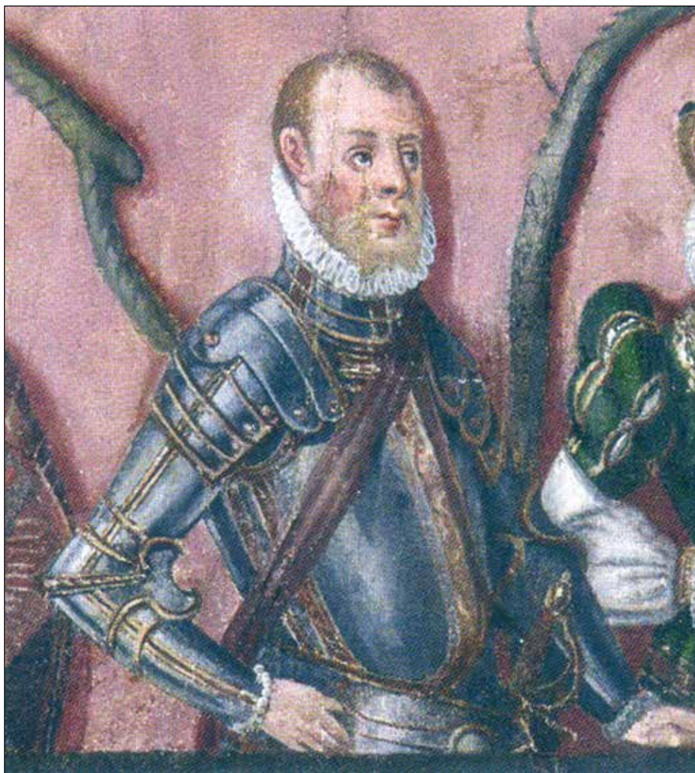
Ryc. 12. Ernest Ludwik na drzewie genealogicznym książąt pomorskich z 1598 r. autorstwa Corneliusa Krommeny, wg Makala 2013b, ryc. 115