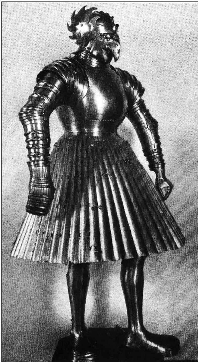
Ryc. 14. Zbroja Albrechta Hohenzollerna powstała w warsztacie brunswickim, wg Cieśla 2015, ryc. 4