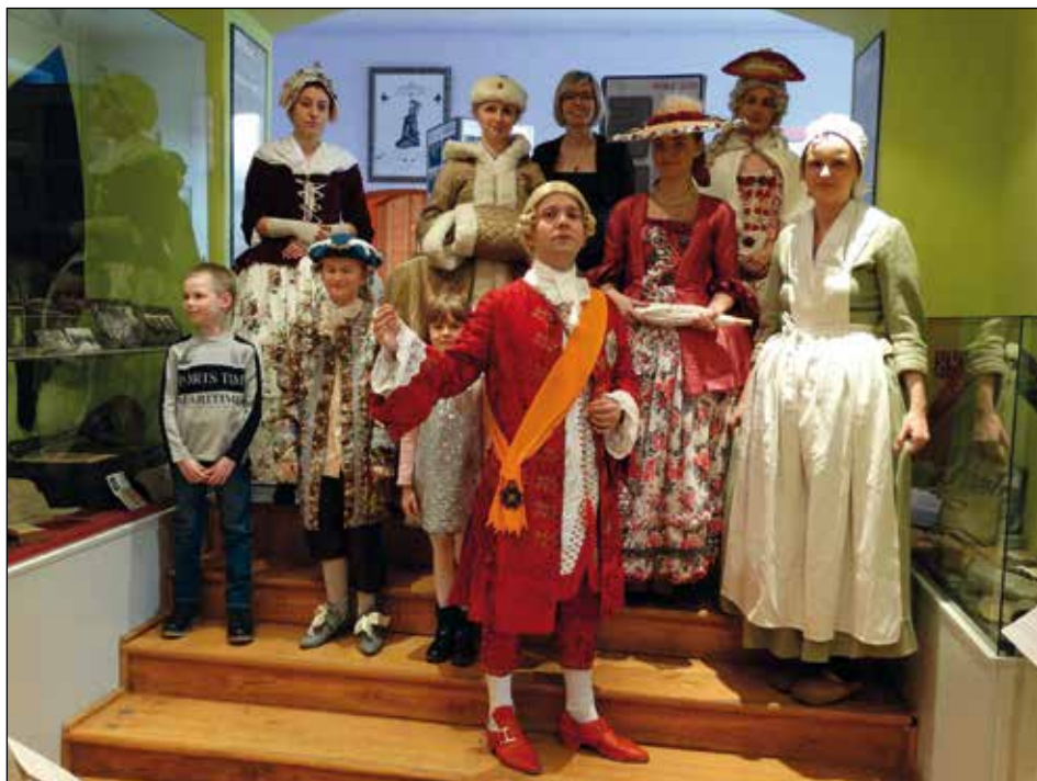
Ryc. 2. Pokaz mody XVIII w. podczas wernisażu wystawy Jaki krój-taki strój...